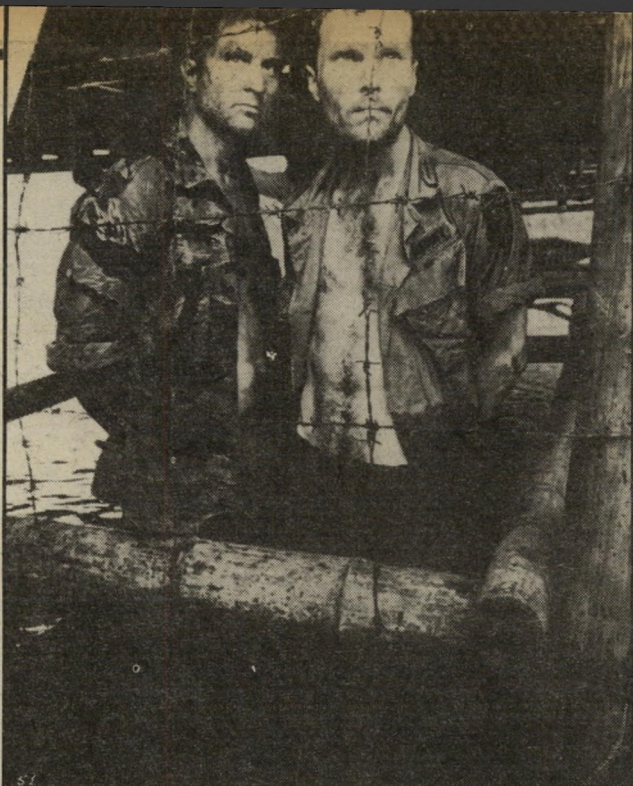
צייד הצבאים ג'ון וייט ורוברט דה-נירו כגיבורים אמריקאים בוייטנאם. סירטו החדש הוא המשך עלילות גיבורו שמונה שנים אחר-כך.

האמריקאית המורכבת מהגרים, הופך הגיבור, קצין משיטרה קשות, גיבור מלחמת וייטנאם שזכה שם ליותר עיטורים מכל שוטר אחר, לאיש הדור הראשון של מישפחת מהגרים פולנית, אשר שינה את שמו כדי להשתלב בציבור האמריקאי.