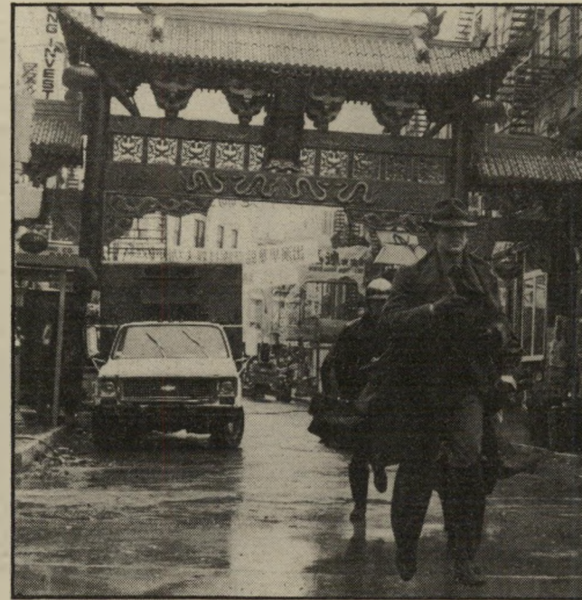
הרובע המשוחזר אחד המיבצעים המרשימים והיקרים ביותר של הסרט שנת הדרקון הוא הרובע הסיני, ששוחזר כולו באולפן. הרובע הוא שילוב מדהים ומשעשע של כמה רובעים סיניים בהונג-קונג, בואנקובר ובטורונטו. השער מסן-פראנסיסקו.

"הנאמנות למקור היתה גדולה כל" כך, שכאשר הכאנו לכמה מן הסצנות ניצבים מבין דיירי הרובע הסיני בניו יורק, הם ניצבו נדהמים מול דלת הכניסה של ביתם, הנמצאת בתוך אול" פן. היו ביניהם ששלפו מצלמות והתחילו לצלם את הנס הזה!"