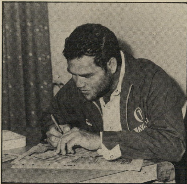
פוליקר ממלא טונו

"פשוט, אני חושב, מצאה אותי. עברתי ברחוב סואן באמצע היום, והיא יצאה מאיזו חצר ועשתה לי מיאו. היא היתה רזה וחולה, עם מוגלה בעיניים. לקחתי אותה מייד לרופא, והוא נתן לה זריקות חיסונים ואנטיביוטיקה. היא הבריאה מהר, ועכשיו היא משגעת. אני מת עליה, זו אהבה-אהבה, היא ישנה איתי בלילה, כשהיא תהיה מיוחמת, לא ארצה שהיא תמליט מייד, ואחסן אותה