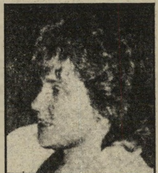
חשודה אן פולארד כמו יהודים בגטו

ליים רבים מאמינים בסטרליבם כי ארצות-הברית היא מעין מושבה של ישראל. שישראל — בעזרת השדולה היהודית — יכולה לעשות בה כנתון שלה. ברור כי מפעיליו של פולארד חשבו כך אף הם. אחרת לא היו מרשים לעצמם להפעיל מרגלים בצורה כליכך חובבנית ובלתי-יזהירה. פרשת-פולארד לא היתה אפשרית במוסקווה.