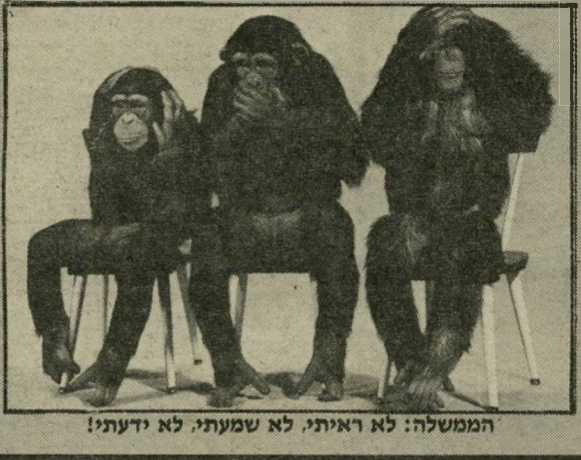
הממשלה: לא ראיתי, לא שמעתי, לא ידעתי!

ורק נזכיר לנשיא האמריקאי ולמקורבין שמדינת ישראל אינה נוהגת בשיפלות-רוח שכזו. ואנו שואלים, ולא בקול דממה דקה: האם נעצר מישהו מאותם 400,000 סוכני ה-C.I.A. שהשתתפו בהפגנת שלום עכשיו, אפילו נחשפו בשעתו. אחד אחד, על-ידי רוני מילוא?