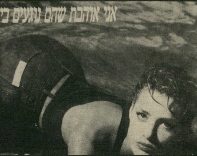
מודעת-המחלוקת מתכוון? מתרטב?

כליכך פחדתי והייתי בהלם. שבקר שי ירברתי. היה שם אסיר שמגיש קפה, והוא דאג לי מאוד והגיש לי פירות ועוגה, אבל לא הייתי מסוגלת לאכול כלום. רק שתיתי קפה ועישנתי. הרגשתי רע, היו לי כאבי-ראש נוראים. אחר-כך הגיע קצין-מורידעין והוא שאל אותי אם ניסיתי להעביר לך משהו נוסף חוץ ממיכתב. ידעתי בדיוק למה הוא מתכוון, ואמרתי שלא. והוא