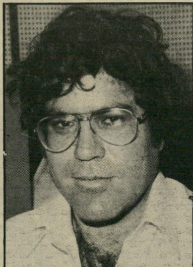
כתב אורן היתה או לא היתה?

תיאם, משנה אותו ואת הפתיחות של הכתבות. בשבוע שעבר, למשל, העביר אליעזר פנינגל כתבה שמישפט-הפתיחה שלה היה: "היו מימור שיום כבודסה". זלינגר שינה את הפתיחה ואמר: "הבורסה קרסה" למרבה האירוניה, כחדשות