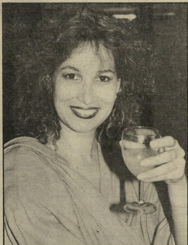
שהתחבבה על קהל הזאטוטים בתוכנית הטל-וויזיה רחוב סומסום. בתפקידה כקיפוד ידידו, תי תשיר בפסטיבל הילדים של חנוכה שיערך בקפה של הבימה.