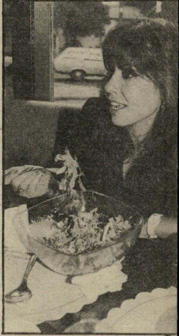
פסטיבל עם נידו גוב, שינב ליד הזמרת היפהפיה.

חגי-החנוכה הוא חג המקבים, הסכיבונים, הסופגניות ורמי-החנוכה — כך לפחות היה פעם. היום חגי האורים הוא החג שבו חוטפים הילדים את אמא ומובילים אותה לאחד ממופעי הילדים.