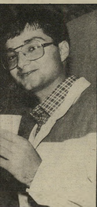
הרים כוסית עם כמון עיתונאים בשנות ה-70 בתצלום המפיקה רנית מישורי והכתב