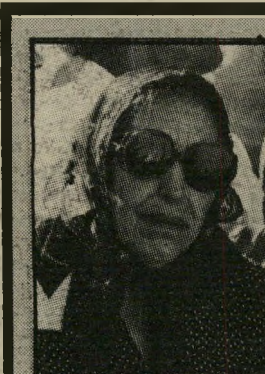
ישעיהו לא הפלה