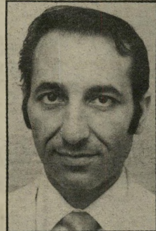
מנכ"ל „מוטורולה“ שהמזון מדוע סירב —

אנשי מוטורולה לא תבעו רק את עלבונם, במישפט: „הבטחה למוטור-רולה בעניין הקמת מערכת זו ניתנה על-ידי המישרד.“ הם הסבירו שהם טובים מכל המתחרים האחרים, שביקשו לו לקפוץ על הפרוייקט, ושהפסקת הפעילות עלולה לגרום להם הפסדים בשווי של מאות מיליוני דולארים, בשל ביטול מכירות של ציוד דומה, שהחברה בשיקאגו אינה מעבירה לארצות ערב בשלב זה.