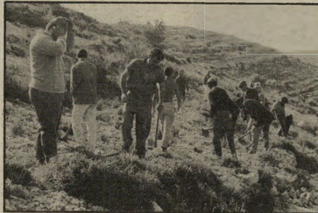
אנשי "בזק" מקבלים הסבר על גידולים חקלאיים

דובר חברת בזק מסר במסיבת-עיתונאים כי בבדיקה שערכה החברה באזור הר מרכז, גילתה גידול גדול במרכזיה של גוש-דן. הגוש (הגידול) — לא סרטני, ככל הנראה — הורחק בניתוח מסובך, אך תעבור תקופת-זמן ניכרת עד שהמרכזיה תחזור לתפקד כרגיל. עוד הוסיף הדובר כי גידול זה גרם לרוב התקלות בתיק שורת, ובהן הפרעות שמיעה ועיכול.