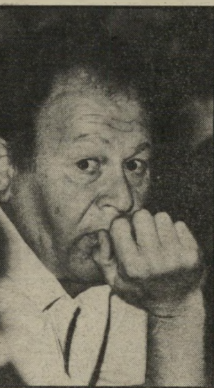
השר גור כולם היו במיתלה!

השר גור — אחרי שמודעי עצמו התנגד לפני שבוע בחריפות לפיטוריו של אריאל שרון, בשל התבטאויות פומביות יותר וחמורות יותר, פרס.