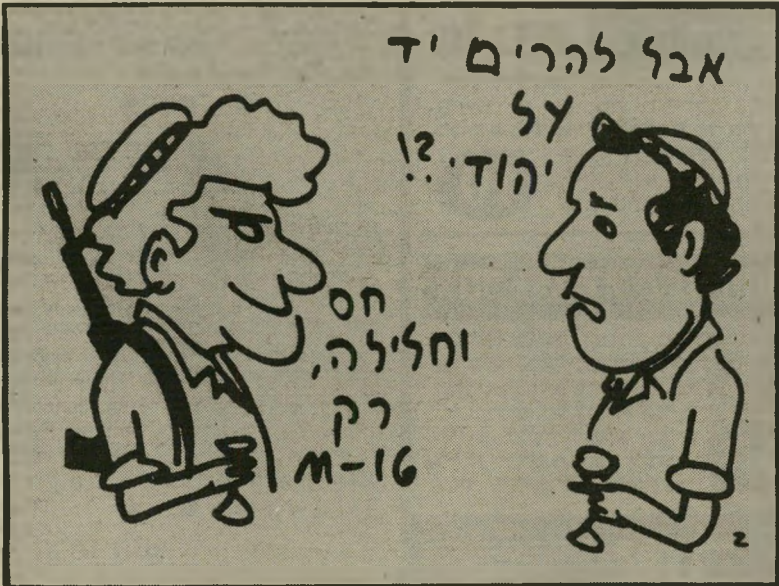
שיח מתנחלים בבל העיר תמונה אחת שווה אלף מילים

אני פשוט מקנא בקורא שוורץ שאין לו דאגות אחרות כחיים מאשר מציאת פיתרון לבעיות הפרשות הכלבים בתל-אביב. אבל למה להצניע רק את הפרשות הכלבים? האם לא מוטב היה להצניע את הכלבים עצמם?