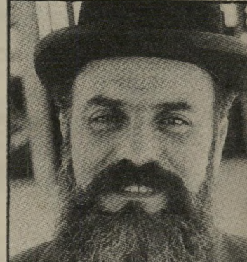
פריץ המנצח האמיתי