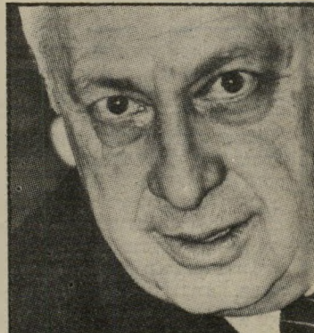
שרון רק שאלה של זמן