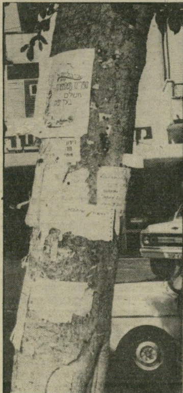
עץ דיזנגוף-פרישמן בראש טוב!

חשביים, בנות גדולות, אנציקלר פדיה מיכלל, מילון אבן-שושן.