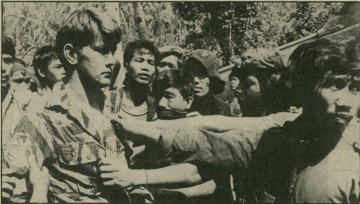
מרטין שין ב"אפוקליפסה עכשיו" — מעיניו הכחולות של אבא

הבימאי, בחר לעקוב אחרי תולדות גרמניה הקטנה של הראש הפשוט, הכפרי, שאינו מבריק ואינו קיצוני, ואף אינו ער כל-כך למאורעות הגדולים המתרחשים קצת מעבר לאפן, אבל לא ממש בקרביו. מ-1910 עד 1982 מתחקה רייז אחרי איש אחד שהלך לשתות בירה והגיע לאמריקה וכפר שלם אנשים פשוטים והדברים המעצבים את הרוח והאופי של חברה גרמנית ממוצעת.