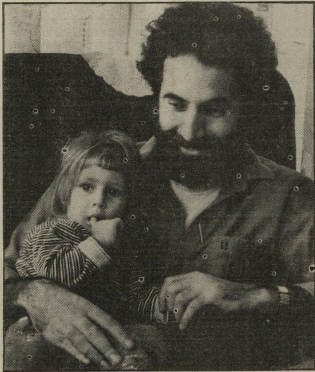
מרותק אמארה ואחינית .איך אפרנס אשה וילדים?"