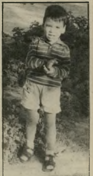
"לא ידועה" כך הגיב אבי בחיור תו ילד על כל דבר שנאמר לו.

הנצח. במיקרה שלו. נמשך בריוק 18 חודשים. קיירד, כיום בן 25, שהקן בתחילת הדרך. יפהתואר, רוה, 1.78 מטר גובה, שוב בחולצת טריקו. ג'ינס משופשף. שיער גתולתל. שלא פגש