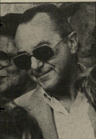
ארנס שר הביטחון האחרון של מנחם בגין היה גם הוא בין מאתיים המשתתפים.