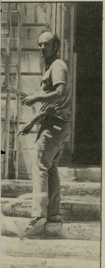
חוקר יפת כמה מרוויחים בחלטורות?

וכך הפכה המערכה העגומה וה"פרטית בין בעל ואשה למילחמה ה"משטעת עכשווית עולם-התיקשורת, שגרמה ליצירת שני מחנות יריבים ולפתיחת תיבת-פאנורמה של שינאות והאשמות הרדיות.