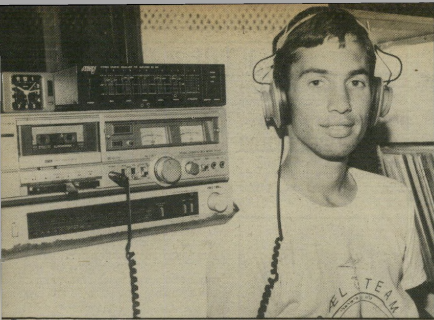
דני בחדרו בבית מסיבה של פיטפוטים היא ביזבוז זמן?