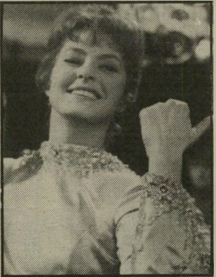
שחקנית ברגמן המאהב עלה על מוקש

נחוג ♦ יום-הולדתו ה-60 של אריה (אריק) נחמקין, שר החקלאות יליד נהלל ואיש המערך. נחמקין, סגן-אלוף בצה"ל שאיכר עין במילח מת-העצמאות, הוא אב לשלושה וסב לשישה, אשר שימש במשך 11 שנים כמזכיר תנועת המושבים ולפני כן, לפי בקשתו האישית של דויד בן-גוריון,