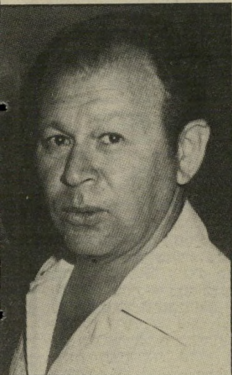
שר גור פליטת-פה

בראס-בורקה בוצע פשע נתעב. על כך אין ויכוח. ממשלת-מצריים חיבת לציבור הישראלי רוח ברור והר-משמעי על מה שאירע, איך ומדוע. אחרי הרצח ירדה על הציבור הישראלי הנדרם מהלומה שניה. נמסר לו כי לפחות חמישה מבין שבעת הקרבנות של החייל המצרי המשתולל לא נהרגו מייד ביירות, אלא מתו בעקבות היחס הרשלני והבלתי-אנושי של החיילים, הקצינים והשילטונות המצריים, שמני-עו הגשת עזרה אשר יכלה להציל את חייהם. הם מתו מאיבוד-דם, שניגר במי שך חמש השעות שבהן מנעו המצריים מן הישראלים שבקירבת מקום — ובניהם רופאים — להציל את בני-מישפחותיהם.