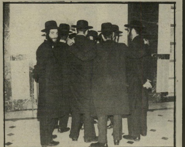
לקוחות עומדים בתור לקיים מצוות

בד בבד עם העליה ב-מיספר החרדים הצובאים על מישרדי-הנסיעות, במטרה לרכוש כרטיסי-טיסה, חלה ירידה תלולה במיספר ה-מבקרים במועדוני-לילה ה-מתמחים בסטרפיטיו. אנחנו שוקלים הגשת תביעה כספית כנגד הנוסעת הישראלית, שהתערטלה ל-עיני חרדים במסוט, וגרמה לנו בכך הפסדים כבדים! כך מסר לכתבנו יושב-ראש בעלי מועדוני-הסטרפיטיו בארץ, השוקל עתה פתיחתה של חברת-תעופה לחרדים בלבד. עוד נמסר לכתבנו, כי חרדים ניסו להפחיד נוסעי-אוטובוס על-ידי הנחת תפי-לן בפומבי.