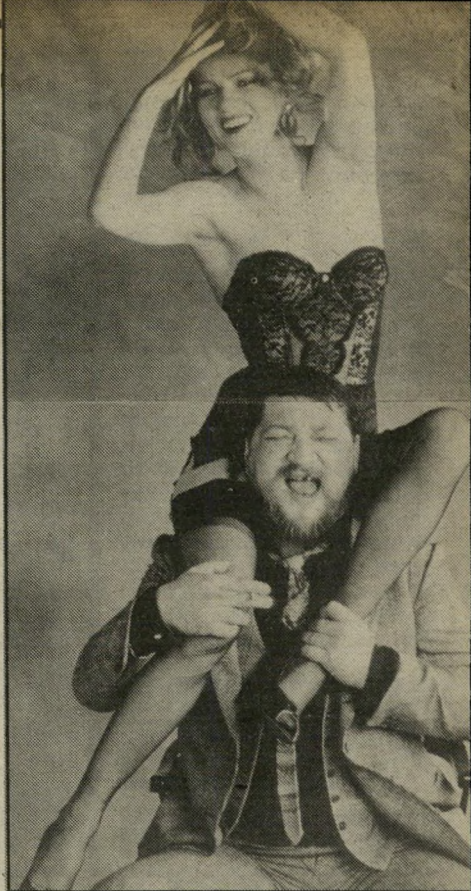
ריינר פסבינדר מבארים לקבלנות בניין

המחזה של פסבינדר מספר על פליט יהודי, ניצול השואה, שעבר לגור בגרמניה אחרי ה-