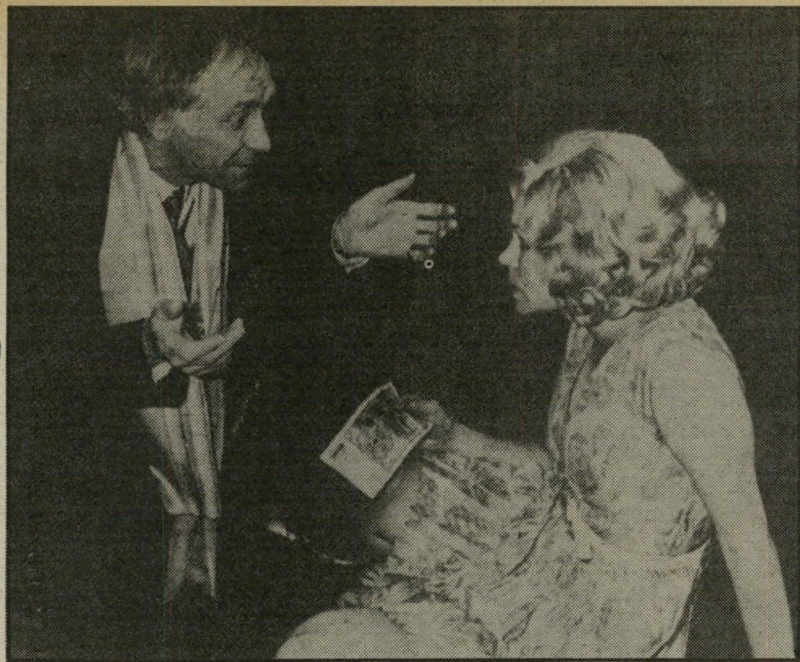
"היהודי העשיר" משלם לזונה במחזה של פסבינדר. הזבל, העיר והמוות" אז למי הוא התכוון, לעזאזל?

היהודים של פרנקפורט הצליחו להוריד מעל הבימה, בינתיים למשך שבוע ימים בלבד, את הצגת מחזהו של ריינר פסבינדר. בארץ התנפח לאנשים החזה מרוב גאווה. הנה גם היהודים הגרים בגרמניה תפסו גאווה לאומית והחליטו להילחם על כבוד העם היהודי נגד האנטישמנים המשמיצים את שמם. ועד כרי כך הם התעצבנו, שהיו מוכנים לעלות לבימה בתיאטרון ולעשות סקנרזלים, עד שכל השחקנים ירדו וההצגה בוטלה.