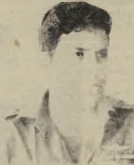
יגה שוב, צוות אמין