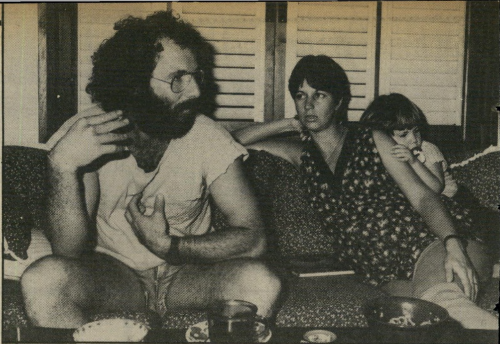
יהוט וצורכי'ביח: 86 אלף שקל לחודש באמוצע לשלוש הנכשוח