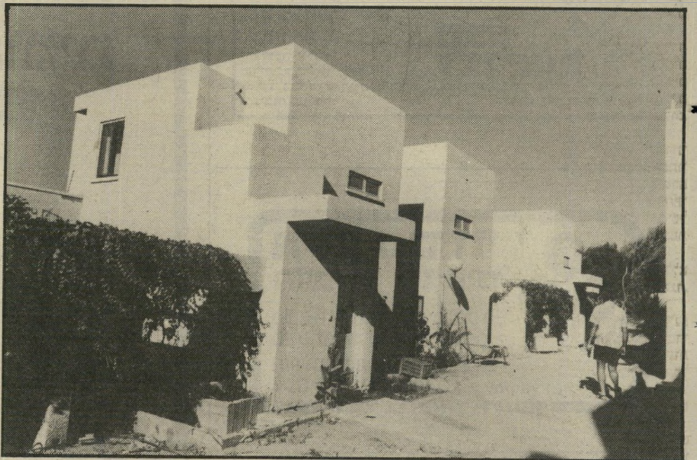
ביח של 4 חדרים, 86 מ"ר: אין בתקציב שכר'דירה ומשכנתא