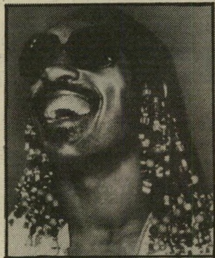
סטיבי וונדר מעורבות פוליטית

האלבום ה-20 של הזמר הכושף העיוור סטיבי וונדר יצא השבוע בהדפסה מקומית, וונדר מגלה באחד רונה נטיה פוליטית ברורה — הוא הקליט שירים נגד הגזענות בדרום-אפריקה. הוא תורם למוסדות פוליטיים שונים הופעות ותמלוגים. מלבד נושאי