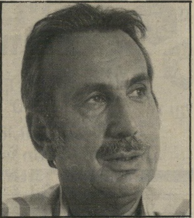
מנכ״ל אלון מחברה לחברה

מדורי המינויים בעמודים הכלכליים מלאים בשמות חדשים וישנים, של מנהלים העוברים ממקום למקום וממשרה למישרה. שם אחד