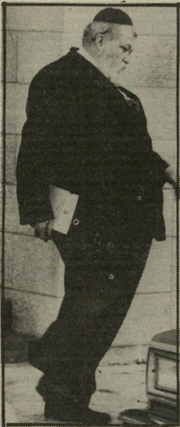
אחד הטייסים חוזר מהמצבה

דיא: אתה לא חושב שזה היה מ'בצע כביר, שארבעה מטוסים אמריקאיים הצליחו ל'ירט ולקרקע את המטוס המצרי עם החוטפים? לוג: אהה! גם כן משהו. אצלנו ארבעה חכ'ים של האגודה קירקעו בזמנו את כל צי המטוסים של חברת אל-על בשבת, וכל זאת מבלי לקום מהכיסא.