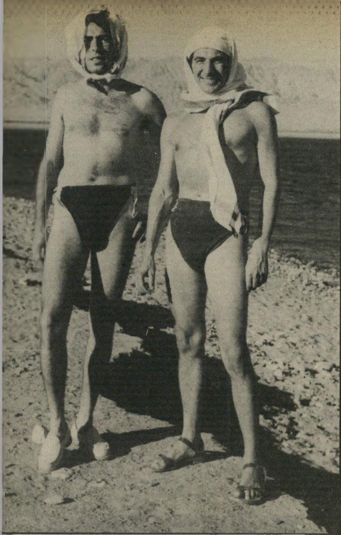
שטרן (משמאל) עם ליאונרד ברנשטיין. על חוף אילת, 1949 גדולי הדור ידעו אודותי!