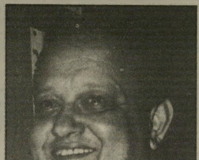
מועמד שילון טיפוח הסיכויים

אני מודה מקרב-לב לוועדת-הכספים של הכנסת, אשר עשתה לנו שרות יוצא-מדהכלל בקבלה את החלטתה הנואלת, והוכיחה מהי הצדה האמיתית - פוליטיזציה משתוללת. עם כל הכבוד שאני רוחש לנבחרי-העם, יש לי כמה תהיות בנוגע להחלטותיה של ועדת-הכספים.