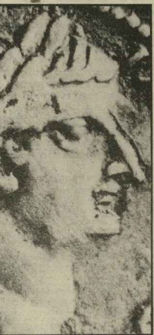
ביבש טיטוס מותר לשחק בספקולציות

מבחינה פוליטית הם לא היו משוגעים. האימפריה הרומית עצמה היתה שרויה באותן שנים במלחמת אזרחים. כשקיסר אחרי קיסר הופל מכיסאו. האפשרות להשתחרר מן העול הרומאי היתה קיימת ומוחשית. ולא לחינם היה לתושבי יהודה זמן ממושך — כארבע שנים — לנהל את מלחמות האזרחים המהפכניות שלהם. כקונסטלציה פוליטית קצת נוחה יותר.