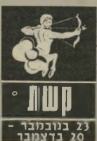
קשת 23 בנובמבר - 20 בדצמבר