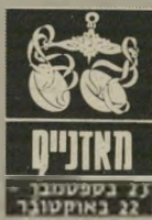
האזניים 21 בספטמבר - 22 באוקטובר

במקום העבודה מיהוה מגסה להתור מתח-תיכם ולפעול נדבכים בסתר. אל תתנו אמון באנשים יותר מדי יד-ידותיים, תתרכזו בעב-דחכם ואל תושפעו מע-צות של אחרים. ענייני כספים עלולים להיות חמורים מאוד השבוע, תנו לשבוע לעבור מבלי לבצע שינויים, לאחר מכן תוכלו להתחיל בפרוייקטים חדשים ו-לצפות להצלחה. בת-חום הרומנטי מצבכם טוב, נצלו את הת-קופה הזו והתניבו את רצונכם לבני-הזוג.