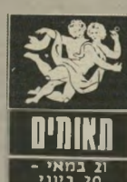
תאומים 21 במאי - 20 ביוני