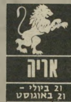
אריה 21 ביולי - 21 באוגוסט

הביטחון שאתם נותנים באחרים יכול לגרום לכם לבעיות השבוע, כדאי להתרחק מבילוי חברתי. יתכן ש-אינכם מרגישים, אך משהו מתבשל סביבכם - ומדובר בעיקר על-מקום העבודה. אל תת-נו לאיש סיבה לדבר עליכם, הקמידו להגיע בזמן ולמלא את כל ה-תפקידים המוטלים ע-ליכם. מבחינה בריאו-תית מצבכם אינו טוב, יתכן שתמצאו את עצמכם מבקרים אצל רופאים ומבזבזים זמן יקר על בדיקות.