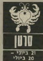
סרטן 21 ביוני - 20 ביולי

למרות שבזמן האחרון המצב הכספי השת-פר, תצטרכו להיות מאוד זהירים. אסור להתקרב לעסקות שיש בהן אפילו שמץ של סיכון. זה לא הזמן לסמוך על המזל וכל צעד מוטעה עלול לגרום הפסדים. ילדים המעוני-ינים בחפץ חדש ויקר יצטרכו להמתין, דחו את הקניה בשבוע אחד. לרווקים יהיו הזדמנו-יות להכיר אנשים מא-רצות אחרות, בדרך מיקרית ומשעשעת. ה-25 וה-26 בחודש דורשים זהירות מיוחדת.