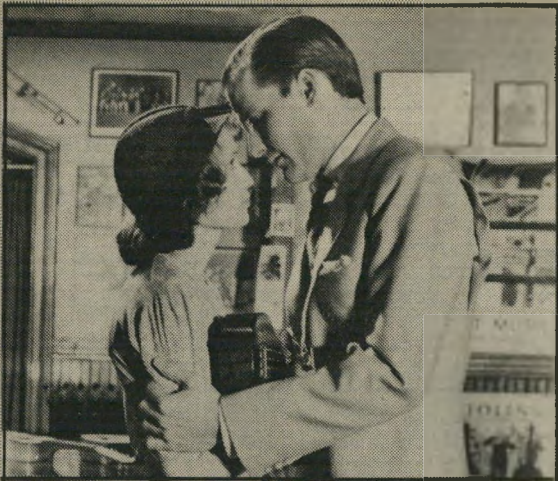
מיה פארו וגוף דניאלס - פנטסיה רומנטית

ססיליה, גיבורת הסרט, היא עקרת-בית הנאלצת לפרנס את בעלה המובטל, בימי השפל הכלכלי באמריקה. נחמתה היחידה הוא אולם בית-הקולנוע השכונתי, שם היא שוקעת בתוך מציאות מופלאה ונעימה הרבה יותר, שהיא מוצאת בסירטי הוליווד המתחלפים מדי שבוע. גיבורי הסרטים ממשיים בעיניה יותר מבעלה גסי-הרוח, ועוללות השחקנים המגלמים את הגיבורים הללו, חשובים לה למחות כמו נישואיה, אם לא יותר. וכאשר, ביום בהיר אחד, יורדת דמות אחת מן המסך ובאה לפגוש את ססיליה, מתבלבלת מציאות אחת באחרת, עולם הסרטים נכנס לעולם האמיתי, תחום החלום פולש אל הגשמיים. הענין מתבלבל עוד יותר כאשר לתמונה נכנס גם השחקן שמגלם את אותה הדמות שיצאה אל המסך, ואז נערכת מגישה משולשת בין היוצר, יצירתו והצרכן שלמענו היא נוצרה. אלן, כדרכו, מוביל את הסיפור הזה בקלילות מתוחכמת, בחיך מלא חיבה לגיבוריו הסרייהישען ומספק סיום שלא היה מבייש גם את צ'אפלין: ססיליה מעדיפה לחיות במציאות