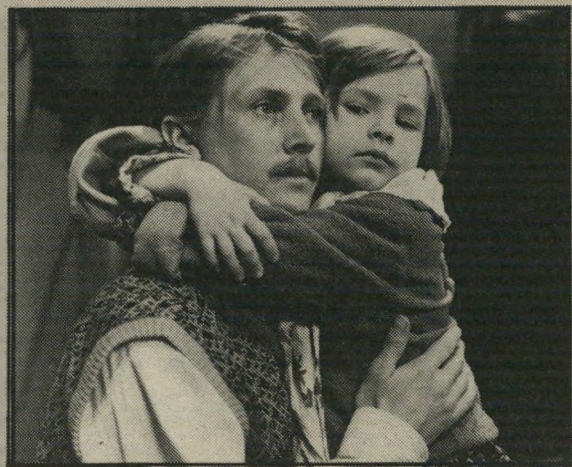
ניקולאי בולייב - מועמדות לאוסקר

הגבר אינו נוגע באשה שהוא מעריץ, האשה החוקית היא אצלת-ימש עד כדי גיחוך, הכל חייבני, טוב-לב, מלא הבנה, בעיות הלינה ובעיות חברתיות חמורות, הנרמזות מה ושם,