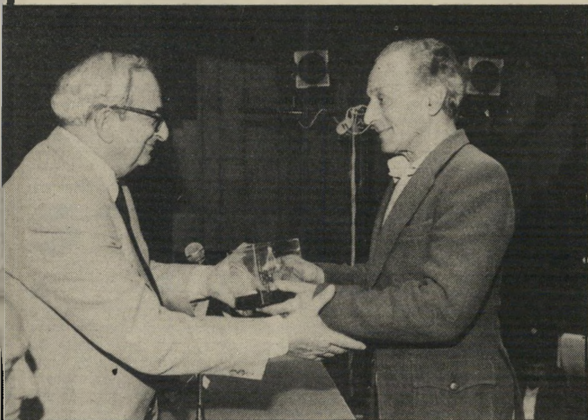
קבלת "כינור דוד" מידי השר נבון על מה?

וכשהחלו לדבר על הקמת טלוויזיה, סירבתי. רציתי בעבודה חלקית, שתאפשר את המשך עבודתי בתיאטרון. בימתי כמה הצגות באהל, בתיאטרון האינטימי, ובעוד תיאטרונים. זו היתה אומנם תקופה פוריה בכימיו, אבל לא היתה לי הרגשה של