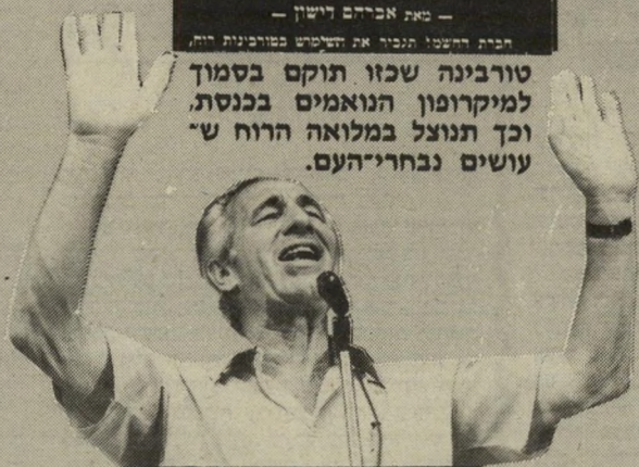
נואם מפיך 4.76 כוח-חוסס

טורבינה שכזו תוקם בסמוך למיקרופון הנואמים בכנסת, וכך תנוצל במלואה הרוח ש- עושים נבחריה-העם.