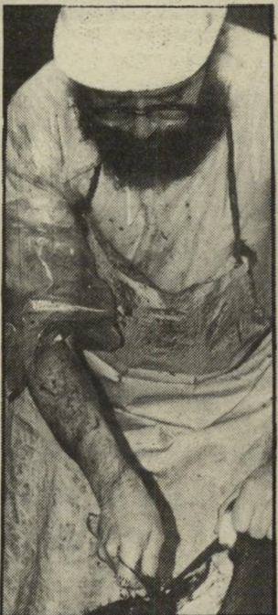
שוטר במדים החדשים

בהתייחסו לפרשת הכאת שני ה- עולים מאתיופיה עד זוכרים עלידי שני שוטרים באשדוד, אמר דובר ה-