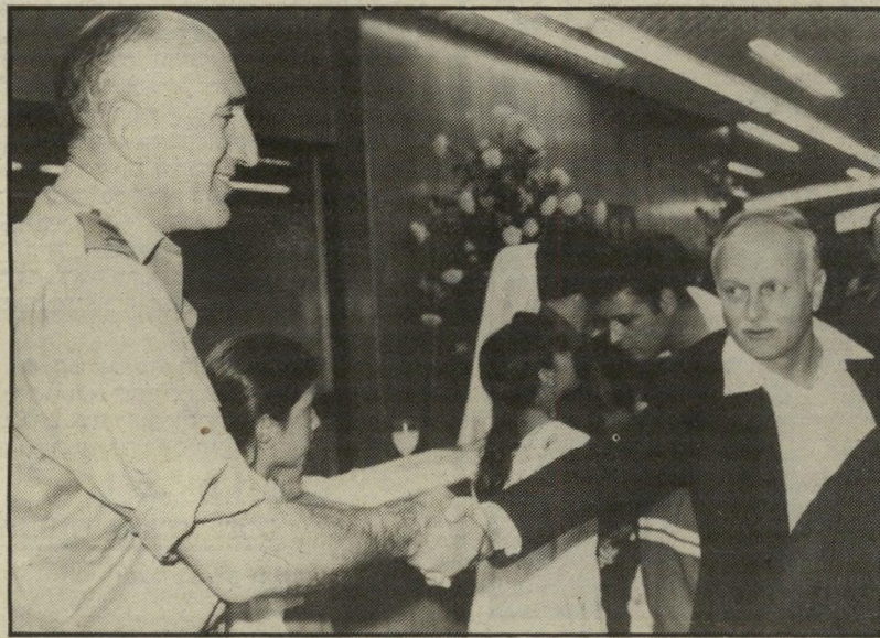
אלוף עברי (מימין) ויודי בעיות הנולים של הטייסים

על מאמרו של אורי אבנרי על מיבצע תוניס (העולם הזה 9.10).