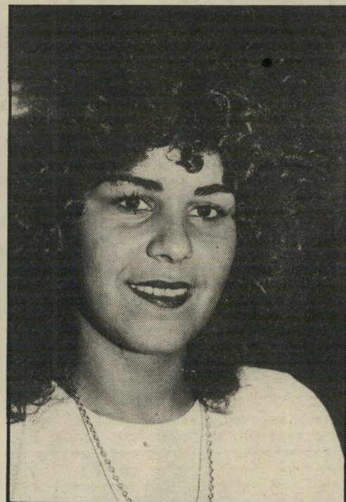
גרושה מזל דנינו אהבה באמצעות תמונה