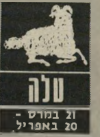
ט'לה 21 במרץ - 20 באפריל

בתקופה זו אתם מוכנים לעבוד קשה ולקחת על עצמכם תפקידים חדשים. נצלו את המרץ המחודש שבו אתם חשים. ונסו לקדם את האינטרסים שלכם בכל תחום שהוא חשוב. בעבודה יהיו עכשיו יו' את הזדמנויות להוכיח את יכולתכם. אם תצ' טרכו לעבור מיבדקים. ראינות ופגישות עם אנשים אשר מבידקים. על עתידכם המקצועי. תוכלו להשאיר רושם חיובי למדי. אם תבי' עו דעתכם ותהיו בטוחים לגמרי בעצמכם.