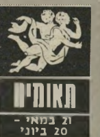
ת'אומים 21 במאי - 20 ביוני

במקום שבו אתם עובדים תצטרכו לבדוק היטב אותם העובדים שבשילכם או איתכם. אל תתנו לרכילות שאי' נה נכונה להתמשט. גם אם לא נעים. חשוב שתביאו לידיעת הנוג' עים בדבר שידוע לכם מה מרחש מאחורי גבכם. ה-16 וה-17 אינם נוחים. ואתם עלולים להתמרץ ולהכריז הכר' זות שלאחר מכן תצט' ערו עליהן. ב-18 וב-19. תהיה אפשרות של פגישות רומנטיות ומהות ומבטיחות. תוכלו לצפות להצעה מושכת.