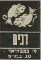
ד'ני 19 בפברואר - 20 במרץ

אתם חשים עייפים ומותשים עומס רב מדי מוטל עליכם. אם עליכם לדאוג לכספם של אחרים. כדאי שתהיו מאוד זהירים. לא כדאי לעסוק בהשקעות. קשי' יים שלכם שליטה עליהם גורמים לדאגה. אך תוך שבוע וחצי המצב יהיה הרבה יותר קל מכל הבחינות. ידי' עה שתקבלו מארץ אח' רת תגרום לאכזבה. אולם מאוחר יותר ית' ברר שזה לטובה. בתחום הרומנטי עליכם להחליט החלטה שלא תוכלו לחזור ממנה.