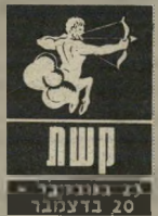
ק'ש 23 בנובמבר - 20 בדצמבר

ה-16 בחודש לא יהיה קל. חשוב שלא תערבו את עצמכם בעניינים שאינם קשורים אליכם. אתם עלולים ל' הביע דעה בעניין שנו' אה בעיניכם כלא צודק. שלא שזה יגרום לכם נזק מאוחר יותר. בת' חוס הכספי תצטרכו להיות זהירים - אל תבצעו עיסקות עם ידידים. אל תלוו להם כספים והימנעו מסיכו' נים בתחום הפיננסי. יחסים שהיו חשובים בעבר יעסיקו אתכם בין ה-16 וה-19 בחודש. שימרו על הניתוק.