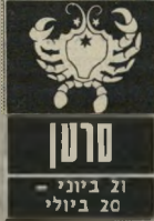
ס'רען 21 בינוני - 20 ביולי

ענייני דיור קרובים לליבכם בימים אלה. אם עדיין לא מצאתם מה שאתם מבקשים. המשיכו בחיפושים. תצ' טרכו להיות יותר חוצפ' נים ונועזים ולהילחם על מה שמוצא חן בעי' ניכם. אם לא חושבים על מעבר לדירה אחרת. לנחות טוב לשפץ את המקום שבו אתם מתג' ררים או לרכוש חפץ חדש. שיוסיף מצב-רוח טוב יותר. ב-17 או ב-18 בחודש תצטרכו להשיגו ולהקדיש יותר זמן משתכנתם - לחיית בית שאתם מגדלים.