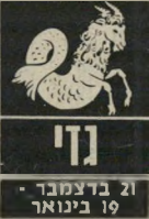
ג'מי 21 בדצמבר - 19 בינואר

בין ה-16 וה-19 בחודש רצוי שלא תקיימו ראינות בענייני עבודה. כדאי שתבצעו את העבודה בשקט ואל תבלטו את עצמכם על פני השטח. ה-15 בחודש יפגיש אתכם עם אנשים המעוניינים לקדם את- כם. לפתע יימצא פית- רון לכל הבעיות שעובדו את ההתקדמות. חשוב שתדעו לשמור על יח' סים טובים עם הסבי' בה. אל תמהרו להעיר ולבקר גם אם זה צודק - עדיף שלא להתערב. בתחום הכספי - לא תררו נחת.