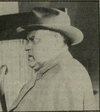
ולם, 1958 המלקצוע: קוסם