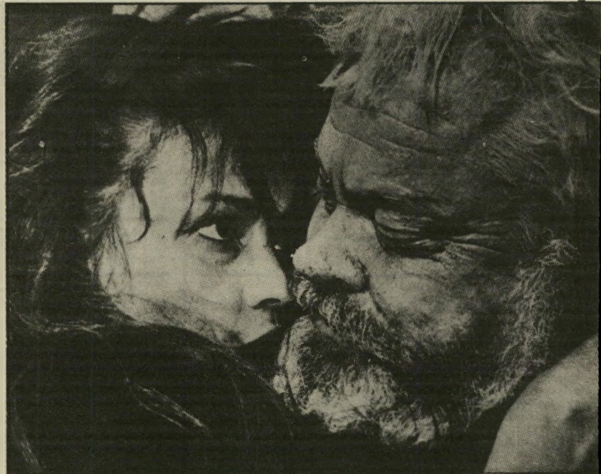
אורסון ולס וז'אן מורו ב„פאלסטאף” (1966) שקספיר האמיתי

והופיע כסרט-פעולה בשם הורד השחור, ובשכר אותו ורד להמשיך בצילומים שנערכו במארוקו. השמועות אומרות שאחד הסרטים המפורסמים שבהם הופיע, האדם השלישי, בויים, לפחות חלקית, על-ידו, למרות ששמו של קארול ריד מתנוסס בכותרות. המידרף האכספרסיוניסטי המפורסם בתעלות הכיוב של וינה, אחרי הופיע הארי לייס (שאותו מגלם ולס), דומה יותר מדי לסרטים שעשה קודם לכן, מכדי שלא יתעורר החשד שהוא היה מעורב בעשייה. מכל העיבודים למחזות-שקספיר שבהם