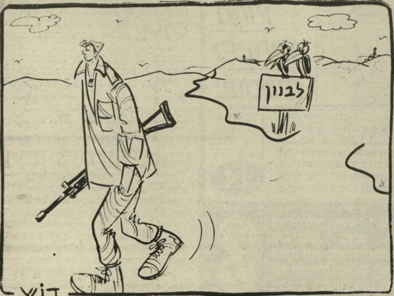
"ראש קטן" של דוש בראש אחד