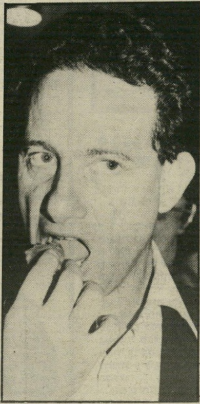
רון ביישי איך אפשר בלי אשה ובלי עבודה?

כבר מזמן שמתי לב לכך שהשינויים בחיים תמיד באים בזוגות, כמו הצרות, כדי שלא יהיה להם משעמם. הנה, רון ביישי, מפקד גלי צה"ל, עוזב את התחנה אחרי שסיים בה את