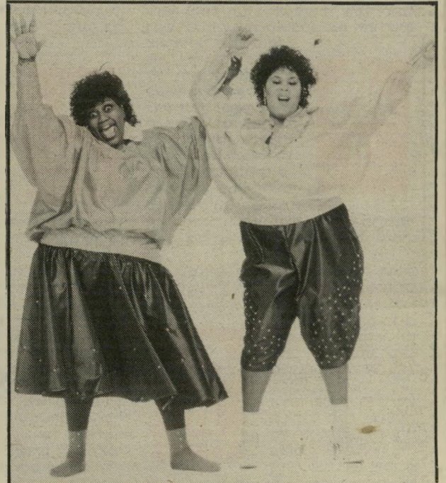
נערות מזג-האוויר שני טון

בשנה שעברה שלט במיצעדים להיט ענק, שנקרא יורד גשם, הל-לויה! שרו את השיר שתי כושיות עני-קיות ככנות 40. בכת אחת הצליחו הנשים, שהסתתרו מאחורי השם נערות מזג-האוויר, לגרום להיט-טריה המונית. שתי הנשים, שעד אז הסתפקו