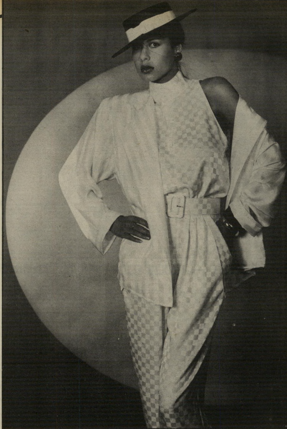
מוכנס מנימה בסיגנון רגלן, הצווארון גולף עומד, הכיסים גדולים וכפל מעטר אותם וחגורה רחבה מבד במותניים. ז'קט מאותו סוג בד, בהדפס שונה.