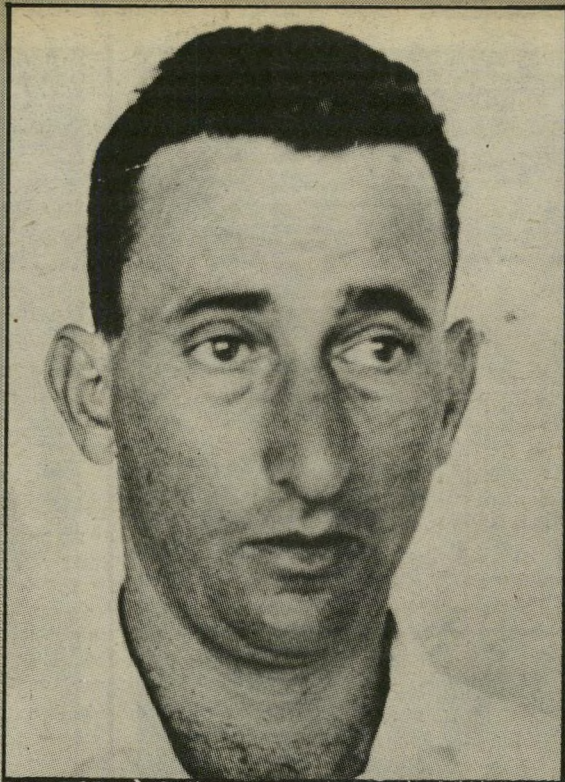
שאוּל ארלוזורוב בלי גט אבל עם ילדה קטנה