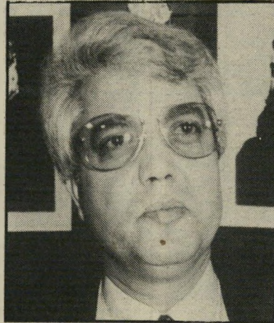
לוי שום דבר!

יפייטר עושה לו שרות יפה מאוד. הוא ילמד את הקהל מה זו מוסיקה אמיתית, הוא מאוד מוכשר. ואחרי הרבה קשיים — הוא מול גדי — סוף-סוף יגיע להצלחה גדולה מאוד.