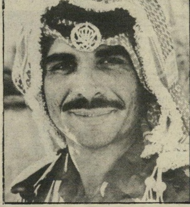
חוסין ירצחו אותו!

שלה יכולה להתפרק. תאריך רומה זה דצמבר ינואר. בעיות ביטחוניות: זה יהיה גרוע באוקטובר, דצמבר וינואר — פיגועים ודברים כאלה, מילחמות כמו בחברון. מה שקשור לממשלה: לפי דעתי באוקטובר יש אפשרות לנפילה ודצמבר ינואר זה בחירות או משהו כזה. משהו ישנתה שם.