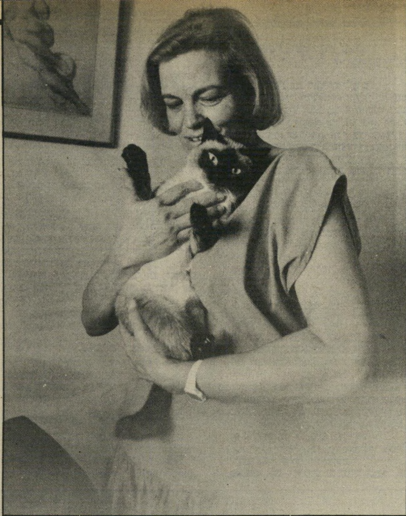
אסטרוולוגית בנימיני והחתולה קוקה