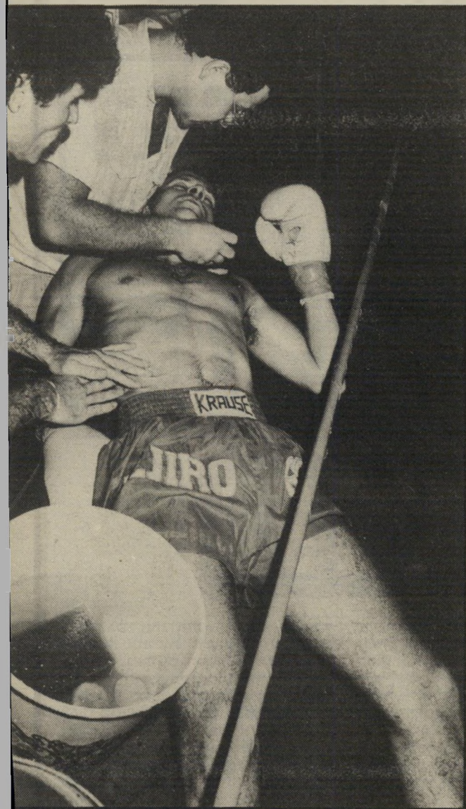
הצוות הרפואי בודק פגיעות איפה הדם?

יציאת ברך באשכים. מרפק כ־מפתח־הלב. בעיטה עזה בכליות — כל אלה תכסיסים מותרים ורצויים בענף ספורט חדש שהגיע לישראל — האיגרוף התאי. שיטת האיגרוף האלימה נולדה כ־תאלנד. השבוע. באולם הספורט על־