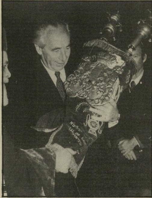
מחווה לרתיים: נושא ספר-תורה ברומניה

היתה זאת הצעה שאיפשרה — גם למי שלא היה מוכן לקבלה כמו שהיא — פתח לפתיחת משאומתן. אולם ישראל דחתה אותה על הסף. היא סירבה לנהל כל משאומתן עם נציגי אש"ף, סירבה למשאומתן בתנאים שהיו אפשריים לחוסיין, והטילה וטו יעיל מאוד גם על הידברות בין ארצות-הברית ושליחי אש"ף וחוסיין.