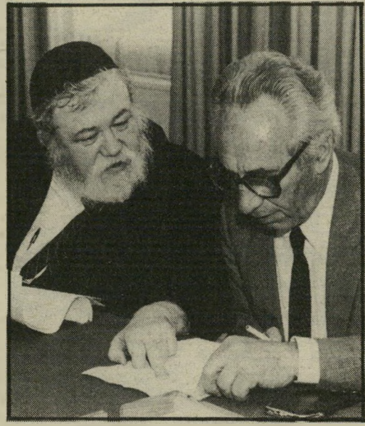
תשלום מראש לרתיים: פרס עם שפירא

כשיא חגיגת-הירידות עם פראנץ-יוזף שטראוס הגרמני, כי 1958, "נתקף פרס", לרבי הביוגרף-מטעם שלו, "בשיכרון חושים מסויים. הרבר נא ליריביטוי כאשר דיבר על המטרות הלאומיות שלנו. הראשונה והעיקרית, אמר, היא שינוי גבולות המדינה. אנו חייבים לשאוף לשינוי גבולות מדינת-ישראל. הוא